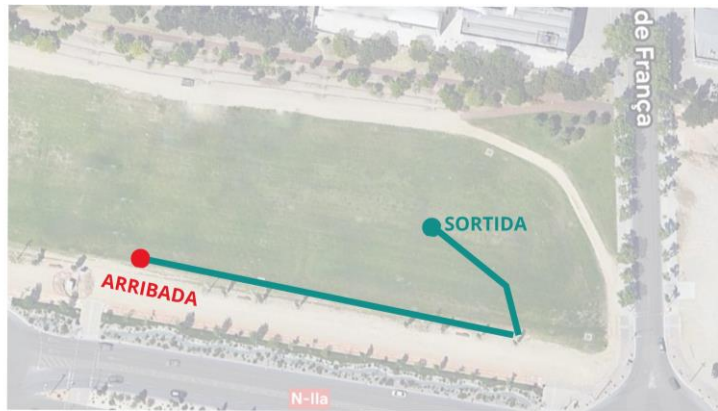
13 - Circuit E: 150m