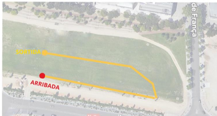
14 - Circuit F: 250m