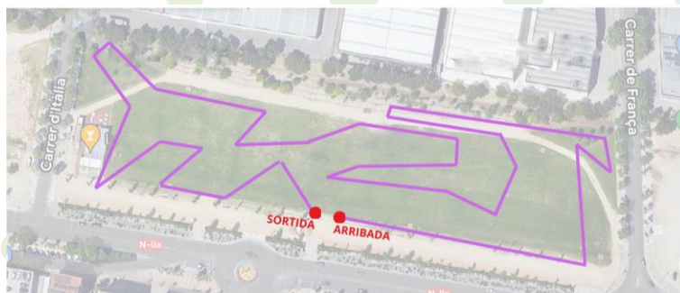
Benjamí - Circuit B: 1000m