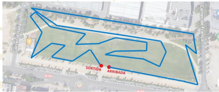
Infantil, cadet i sènior - Circuit D: 1500m