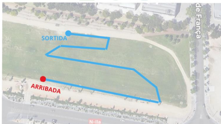
15 - Circuit F: 350m