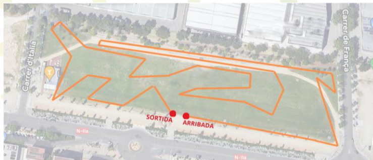
Aleví - Circuit C: 1300m